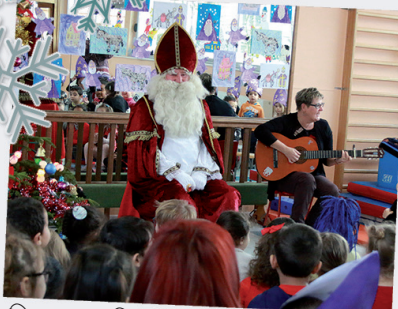
École Eugénie Cotton