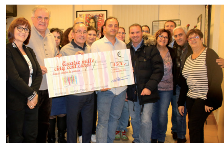
Remise du chèque de 4500 € par l'AACT à la lutte contre le cancer suite à la Talangeoise