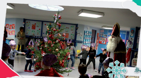
École Le Breuil