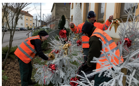
Installation de décorations de Noël par les Services Techniques de la Ville