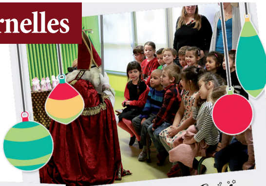
École Irène Curie