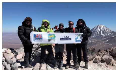
XL Enseignes sur le Mont Pinto (Chili) à 5150m d'altitude