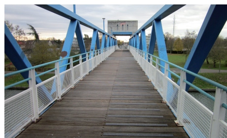
Nettoyage de la Passerelle C. Anstett par les Services Techniques de la Ville