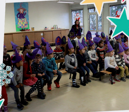
École Elsa Triolet