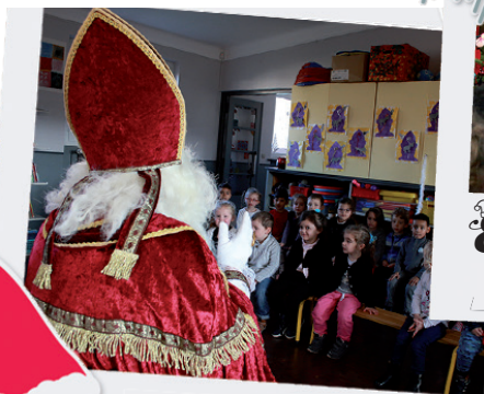
École Emile Zola