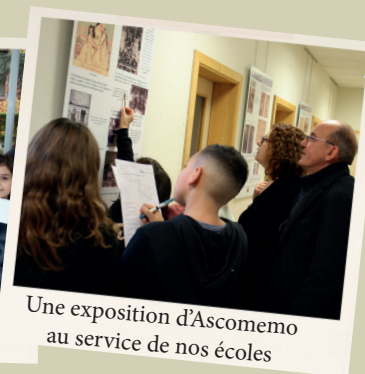
Une exposition d'Ascomémo au service de nos écoles