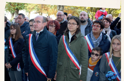
M. le Maire, Le Conseil Municipal et le C.M.J.