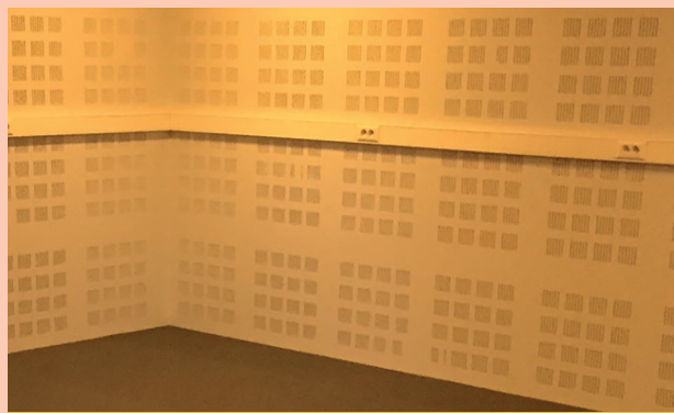
Local de Dériv' Rock