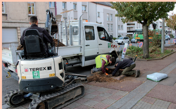
Remplacement d'arbres dans la rue de Metz