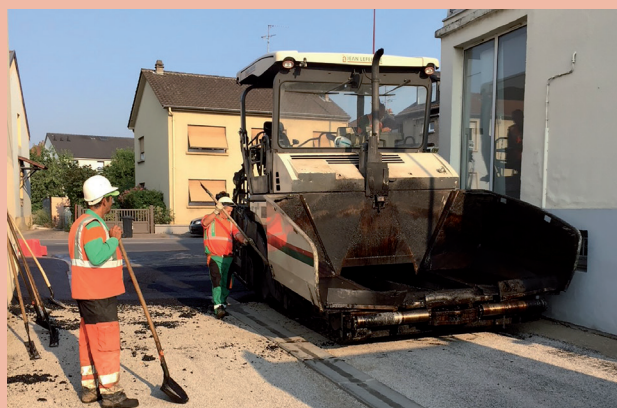
Réfection de la voirie de la rue Privée

Après quelques contacts en 2018, ils ont répondu à la demande de M. le Maire en programmant en octobre la réfection totale de la voirie. Le marquage au sol, d'un montant de 7000 €, a été à la charge de la commune.