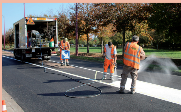
Marquage au sol sur le CD 55 bis

Concernant la rue de Metz, M. le Maire a contacté le Département pour que celle-ci soit rénovée comme pour la RD 55 bis.