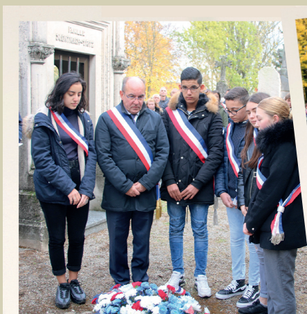
Recueillement à l'Ancien Cimetière