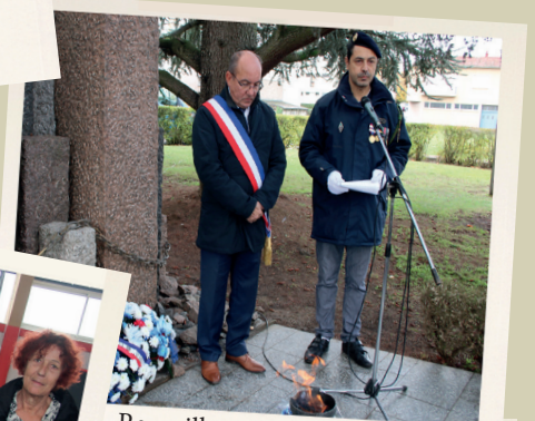
Recueillement au Monument aux Morts