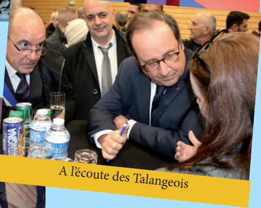
A l'écoute des Talangeois