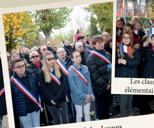
Les classes de l'école élémentaire Jean Burger