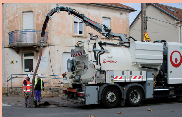
Nettoyage des avaloirs dans la commune

Pour finir, d'importants travaux d'entretien et de rénovation ont été réalisés sur la pompe de relevage près de l'ancien cimetière dans la rue des Alliés. Pour le compte du SMAB, Véolia avait déplacé les conteneurs de ramassage collectifs et réalisé les travaux.