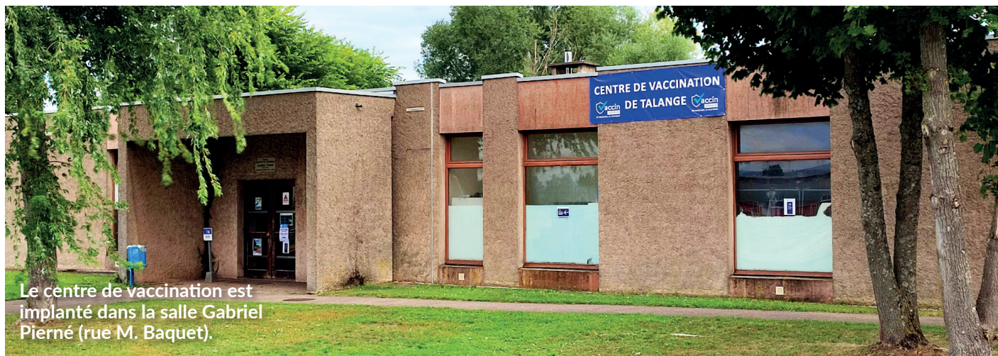
Le centre de vaccination est implanté dans la salle Gabriel Pierné (rue M. Baquet).

► Le personnel médical et les bénévoles ont fait preuve d'une mobilisation exemplaire ces derniers mois. Une dernière session de vaccination se tiendra le 28 février, avant la fermeture définitive du centre. La Ville de Talange a ainsi contribué à l'effort national de lutte contre la COVID-19 en s'engageant au travers de la mise en place de ce centre.