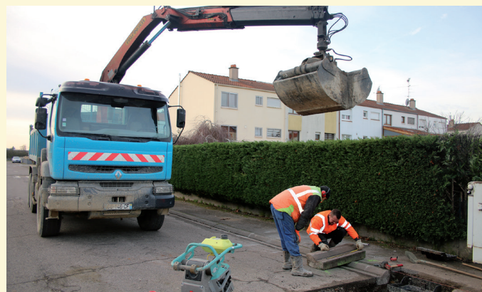
Installation d'avaloirs, rue des Colombes, conformément aux engagements pris avec les riverains suite aux épisodes pluvieux.

de compensation le long de la Moselle qui, pour l'instant, a évité les inondations classiques et historiques à Talange notamment au village et dans le centre. Mais c'est maintenant au Breuil que nous sommes embêtés. On l'a déjà expliqué mais je vais le rappeler ici. Nous avons commandé une étude au Syndicat Mixte d'Aménagement de la Barche (S.M.A.B.) pour faire un diagnostic complet de toute la problématique d'eau et l'évacuation. On a déjà commencé à travailler et je m'y étais engagé lorsqu'en pleine nuit durant les inondations j'ai rendu visite Rue des