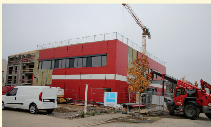
Centre de dialyse en construction : la dynamisation du centre-ville