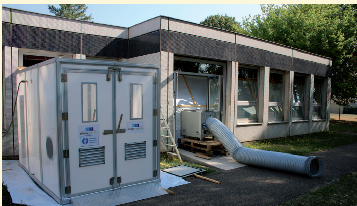
Travaux de désamiantage à l'école Elsa Triolet dans le cadre du programme général d'entretien de nos bâtiments publics

Dans le domaine de l'emploi, nous avons inauguré en 2018 les forums de l'emploi sur le thème de l'industrie que l'on fera en 2019. Avec la Mission Locale, nous allons faire le 1 er salon de l'orientation et de la formation.