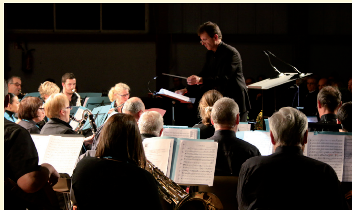
L'orchestre d'Harmonie de Talange qui a embelli cette cérémonie