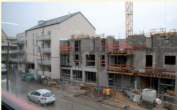
A proximité de l'EHPAD, les logements Seniors en construction en synergie avec la politique Municipale et Communautaire

Colombes à des gens qui étaient bien embêtés parce qu'ils étaient vraiment dans l'eau jusqu'aux genoux. On a déjà commencé à ajouter des avaloirs qui se sont effectivement avérés absolument utiles pour améliorer la situation.