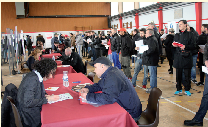
Forum de l'Emploi 2018

La Communauté de Communes Rives de Moselle est partenaire aussi pour une proposition que je fais de longue date, un changement de la politique seniors qui nous permettrait de dépenser moins en termes d'investissement et de laisser plus de latitude aux collectivités pour mettre en œuvre leurs projets et ainsi d'allier l'intelligence collective et la sauvegarde de l'intérêt de la strate communale. Et puis, un projet sympathique que mes Conseillers Communaux et Municipaux ont présenté à la commission «Déchets ménagers» qui consiste à mettre en œuvre une expérience qui se passe bien à Talange depuis maintenant 4 ou 5 ans, la donnerie. Cela consiste à associer à nos déchetteries une donnerie. C'est à la réflexion et ce n'est pas si bête que de laisser des gens venir se servir des objets dont les autres ne veulent plus.