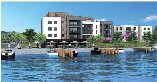
La halte fluviale à Talange : perspective de développement touristique pour notre Communauté de Communes

Il restera, malheureusement, le très mauvais choix d'aménagement de territoire et le très mauvais choix financier de la construction de cette piscine qui est d'ailleurs toujours en panne et qui marquera l'histoire de notre Communauté de Communes de manière plus que négative. Ceci dit, ce qui m'intéresse aujourd'hui ce sont les défis à relever, le travail à faire en termes d'accueil d'activités supplémentaires comme par exemple la future hôpital Claude Bernard notamment, mais aussi en termes de mobilité. C'est une responsabilité que j'ai acceptée et qui n'était, d'ailleurs à ce jour, pas prise en charge.