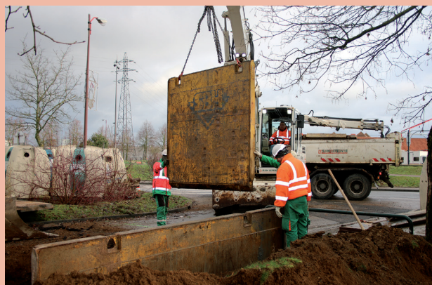
Installation des conteneurs enterrés - Rue des Alliés

Les équipes des Espaces Verts des Services Techniques ont procédé au cours des dernières semaines à de nombreux travaux courants comme l'élagage d'arbres, des plantations à divers endroits de la ville (près de la déchetterie, rue des Alliés...) ou le ramassage et compostage des sapins dans le cadre de l'opération « recyclons nos sapins ».