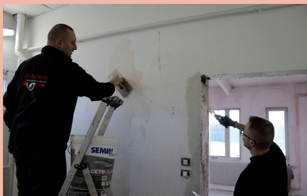
Travaux par les Services Techniques dans le local tennis au COSEC