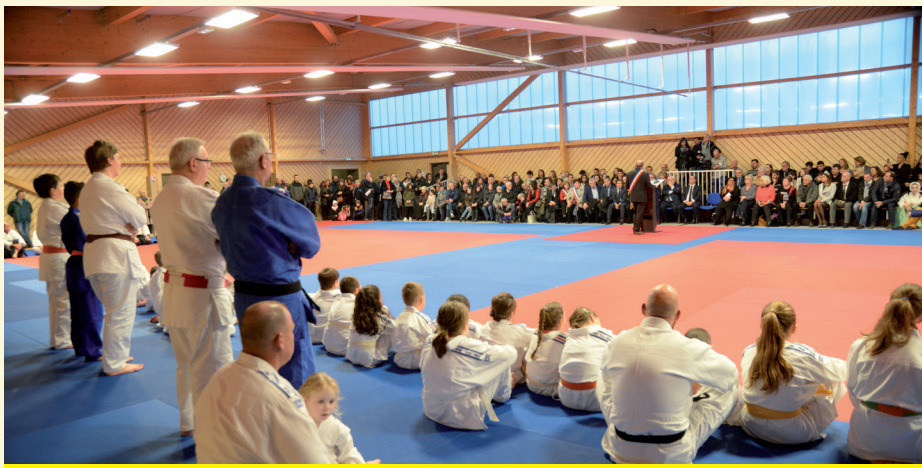
Inauguration du Dojo «P. de Coubertin» le 12 décembre 2018

Nous avons fait un certain nombre de travaux importants dans les écoles en termes de désamiantage, dans nos équipements publics en termes d'accès aux personnes en situation de handicap, nous mettons en route un ascenseur à la Maison des Associations et on va en profiter pour désamianter le bâtiment. Tout cela a été fait sans augmenter les impôts, en tout cas la part locale, depuis plus de 10 ans maintenant.