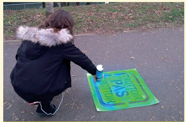
Opération «Trottoir, pas crottoir» : une initiative du Conseil Municipal des Jeunes

nombre de Talangeois qui ne comprennent pas l'utilité d'habitations et de ménages supplémentaires. Je voudrais juste rappeler - et un article de presse sur le dernier recensement le montre bien - que Talange commence seulement, après de nombreuses années d'efforts durant lesquelles on a réhabilité des logements, à stabiliser et à légèrement augmenter sa population. Je veux rassurer tout le monde. Nous n'avons pas l'objectif, ni les moyens, de gagner des milliers d'habitants supplémentaires, ce n'est pas du tout l'objectif. Nous sommes sur un objectif de 8000 habitants et d'une certaine stabilité. Il est absolument nécessaire de garder cette population, il est absolument nécessaire d'accueillir des jeunes couples et de leur proposer des logements et des maisons qui sont adaptés à leurs ambitions d'aujourd'hui. On ne peut pas laisser vieillir une population, il