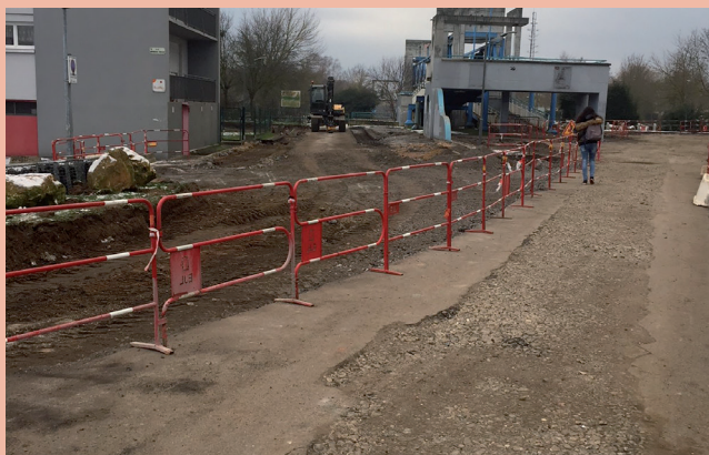
Travaux d'assainissement rue Einstein