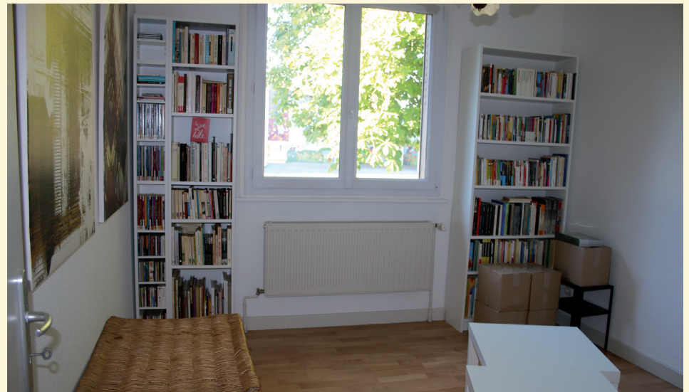
Maison du Théâtre de l'Espace Molière inaugurée le 26 septembre 2018

Concernant les équipements sportifs, je ne vais pas redire ici tout ce qu'on a pu faire et la grande fierté d'avoir pu cette année inaugurer un dojo en présence de l'ancien Président de la République, François Hollande, et aussi en même temps, d'avoir inauguré une salle pour les boxeurs en concertation avec nos