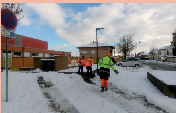
Déneigement par les Services Techniques