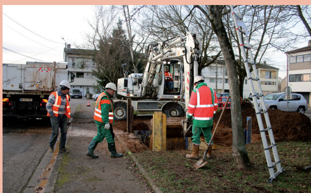
Installation des conteneurs enterrés - Rue des Roses