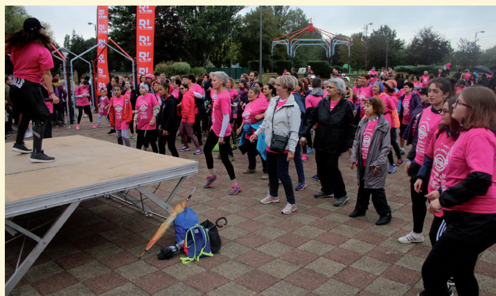
La Talangeoise 2018