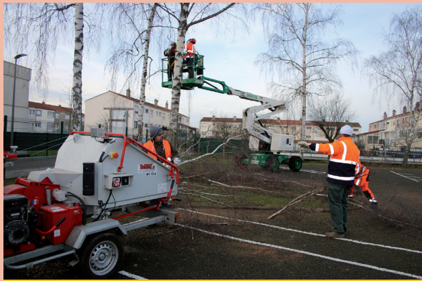
Élagage d'arbres à l'école J.J. Rousseau