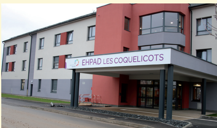
L'EHPAD «Les Coquelicots» ouvert en octobre 2017

Il nous restera d'ici 2020 trois importants chantiers qu'il faudra que l'on fasse avancer : celui de la rue de l'Usine, celui de la rue Pasteur et celui de la rue Ambroise Croizat.