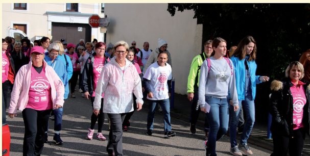
La Talangeoise le dimanche 17 septembre 2017

Dans la ZAC des Usènes du côté de Maizières-lès-Metz, grâce à une