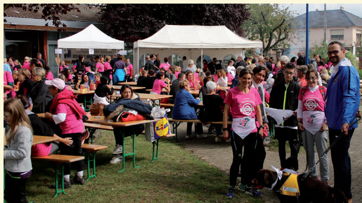
Fête des Passerelles 2017