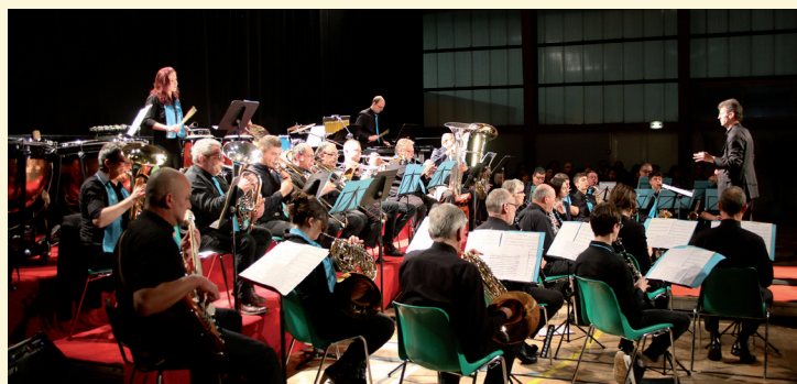
L'orchestre d'Harmonie de Talange qui a réhaussé cette cérémonie