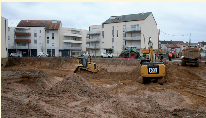
Début des travaux du centre de dialyse en novembre 2017

Moi je le regrette, mais peut-être n'est-il pas trop tard...,