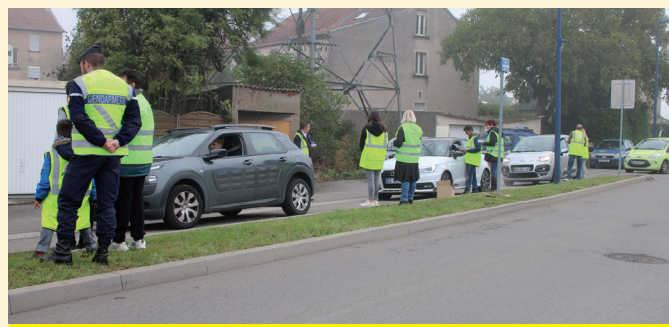
Action de prévention routière le samedi 16 septembre 2017

Cet engagement municipal qui est un engagement de terrain, je le partage avec mes Conseillers et l'ensemble du personnel. Nous en sommes extrêmement fiers.