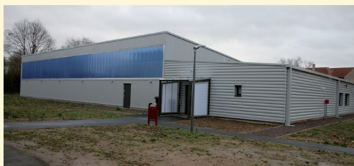
Le nouveau Dojo est maintenant opérationnel