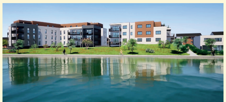
Projet d'aménagement - ZAC des Usènes