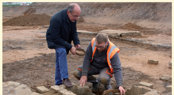
Fouilles archéologiques sur le site des Usènes