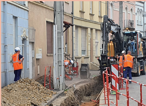
Rue de l'Usine - Début de la seconde tranche