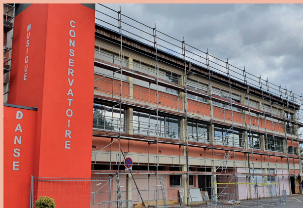
Rénovation thermique du Conservatoire Municipal

Le Conservatoire Municipal Georges Brassens fait peau neuve avec le début du chantier de rénovation thermique du bâtiment. L'échafaudage a été installé et les interventions des différentes sociétés ont commencé. D'un coût de 450 000 € hors taxes, ces travaux consistent en un désamiantage et un changement de la toiture, un changement des menuiseries extérieures ainsi qu'à une isolation extérieure du bâtiment.