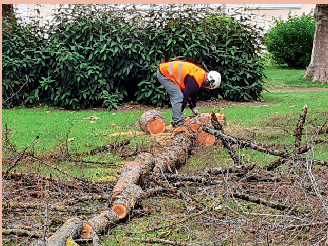
Elagage - Place Jean Burger