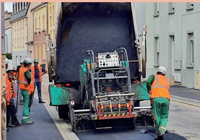
Rue de l'Usine - Pose des enrobés