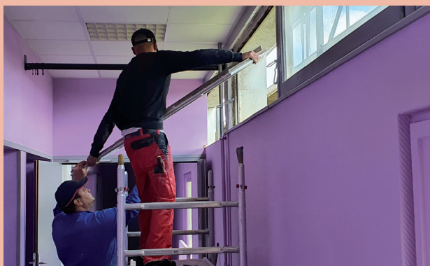
Conservatoire Municipal - changement des menuiseries