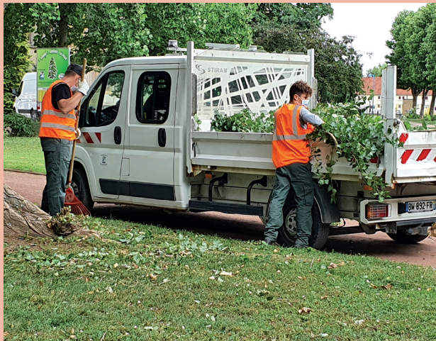
Elagage - Place Jean Burger