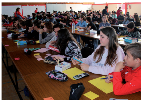
Concours «Des chiffres et des lettres» par le Collège «Le Breuil»