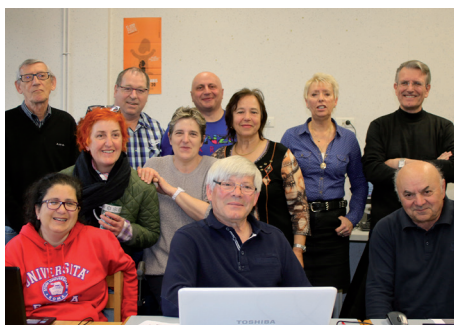
Atelier Informatique - Secteur famille du CLTEP