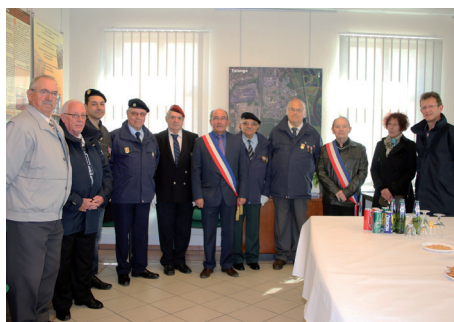
Cérémonie : «Journée de la Déportation»