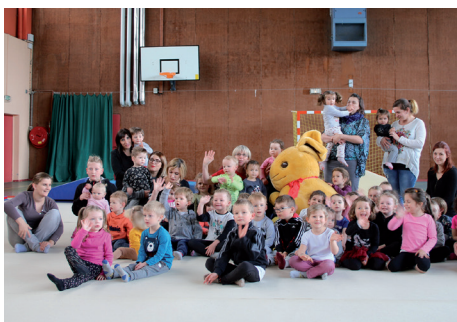
Chasse aux oeufs de l'ASOT Gymnastique