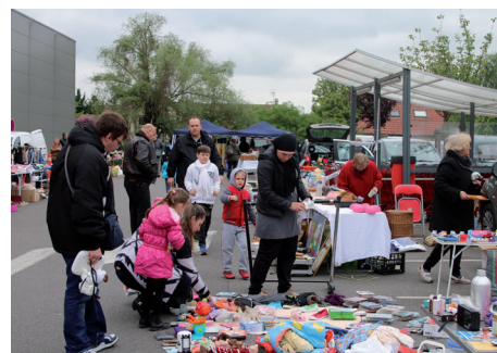
Vide-Grenier des Placomusophiles