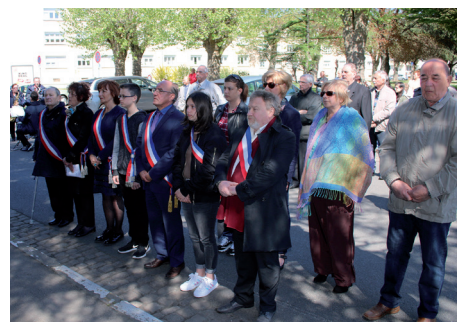
Cérémonie : «Journée de la Déportation»