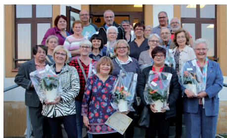
Réception des Maisons Fleuries