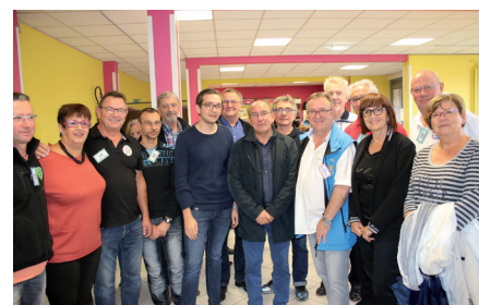
Inauguration de la Bourse des Placomusophiles Talangeois