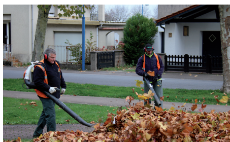
Nettoyage des feuilles par les Services Techniques de la Ville