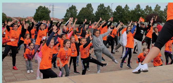
La marée orange s'échauffe avant la course