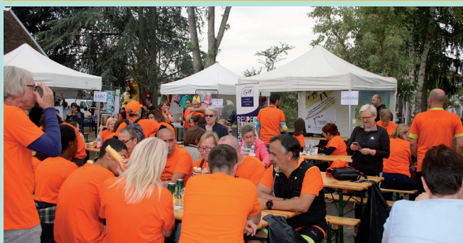
La journée des associations