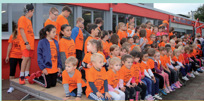
Les enfants récompensés de leurs participation

- Dimanche 22 septembre , la 6 ème édition de la course La Talangeoise , organisée par l'Association des Artisans et Commerçants de Talange (A.A.C.T.) au profit de la lutte contre le cancer, a lancé la dernière journée de festivités. Les courses enfants et adultes ont réuni plus de 500 participants au départ de la Salle M. Baquet pour une arrivée au Complexe Raymond Lambert. La course a ensuite laissé place à la journée des associations où de nombreuses associations talangeoises ont pu faire leurs promotions autour de jeux gonflables, de trampolines ou encore des promenades en calèche... Lundi 22 octobre, un chèque de 7000€ a d'ailleurs été remis au profit de la lutte contre le cancer par l'Association des Artisans et Commerçants de Talange.