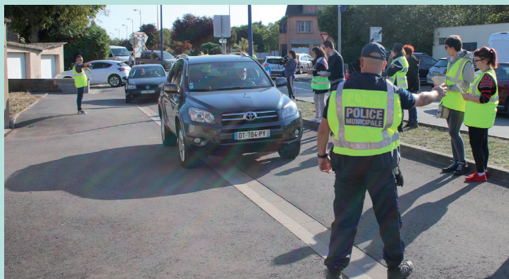
Opération de sécurité routière

- Samedi 21 septembre, des Ateliers Citoyens se sont tenus dans la matinée avec une opération de sécurité routière au rond-point Haricot. Cette opération a mobilisé la Gendarmerie de Maizières-lès-Metz, le Conseil Municipal des Jeunes (C.M.J.), la Police Municipale et les Elus. Au même moment, un atelier de fleurissement a eu lieu à proximité de l'école maternelle du Breuil suivi de l'inauguration de l'aménagement du square des coccinelles. A 16h30 s'est tenue la 25 ème édition de la manifestation « Un Arbre, un Enfant, la Ville ». La cérémonie s'est terminée par le dévoilement de l'emblématique arbre mentionnant les talangeois et talangeoises nés en 2018.