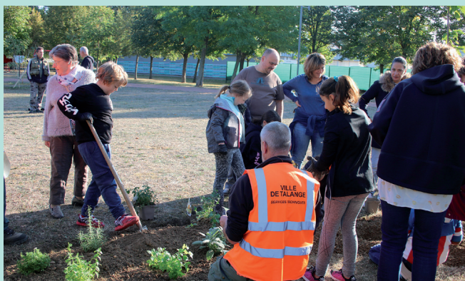
Atelier de fleurissement