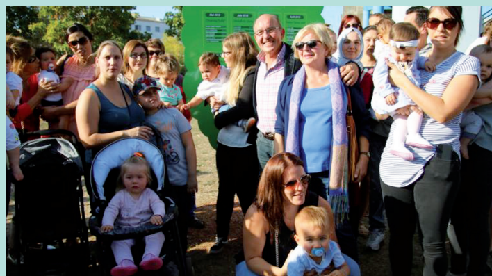
«Un Arbre, Un Enfant, La Ville»

- Dimanche 22 septembre , la 6 ème édition de la course La Talangeoise , organisée par l'Association des Artisans et Commerçants de Talange (A.A.C.T.) au profit de la lutte contre le cancer, a lancé la dernière journée de festivités. Les courses enfants et adultes ont réuni plus de 500 participants au départ de la Salle M. Baquet pour une arrivée au Complexe Raymond Lambert. La course a ensuite laissé place à la journée des associations où de nombreuses associations talangeoises ont pu faire leurs promotions autour de jeux gonflables, de trampolines ou encore des promenades en calèche... Lundi 22 octobre, un chèque de 7000€ a d'ailleurs été remis au profit de la lutte contre le cancer par l'Association des Artisans et Commerçants de Talange.