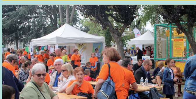
La journée des associations