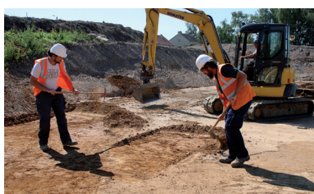
Fouilles archéologiques aux Usènes