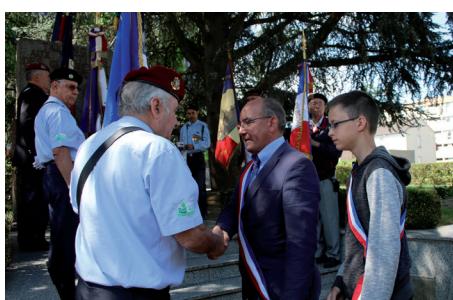
Fête Nationale Cérémonie patriotique