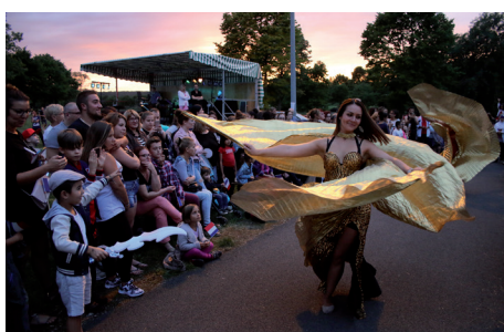
Fête Nationale Feu d'artifice sur les berges du canal