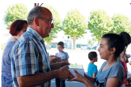
Remise des dictionnaires aux enfants de CM2 entrant en 6 ème à l'école Jean Burger