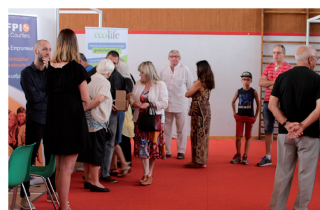
Salon de l'Habitat