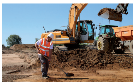
Fouilles archéologiques aux Usènes