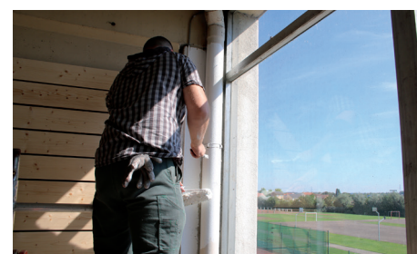
Travaux au COSEC P. de Coubertin