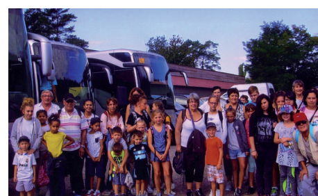
Journée des Oubliés par le Secours Populaire 58 personnes à Frais Pertuis le 23 août