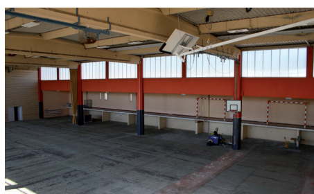
Travaux au COSEC P. de Coubertin