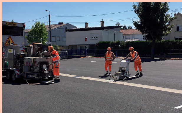
Marquage au sol du parking de la Maison des Associations