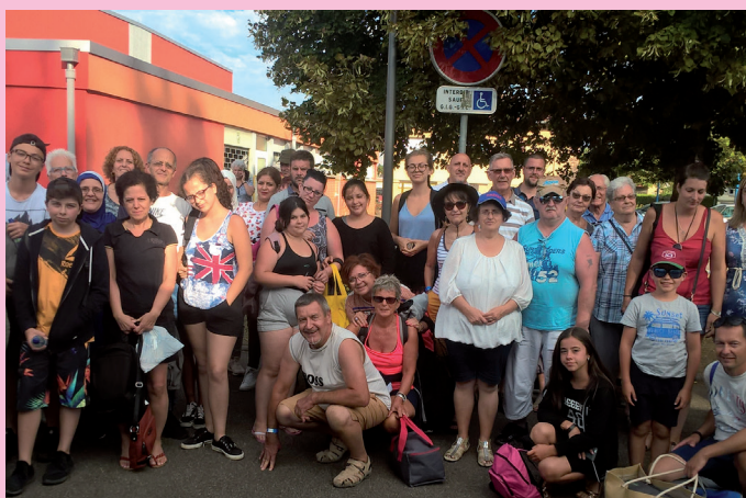
Sortie famille au lac de Pierre Percée dans les Vosges le 28 juillet Au programme : Mini-golf, pédalo...