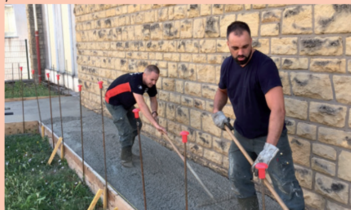
Les Services Techniques en action

«Pour le bon déroulement de la rentrée, élu(e)s et services municipaux de la ville (scolaire, technique, agents d'entretien...) sont sur le pont pour que tout soit prêt dans les temps. Tous les ans, nous essayons d'améliorer les conditions d'accueil des enfants et des enseignants. Les classes sont agréables et accueillantes pour tout le monde.» souligne le Premier Magistrat.