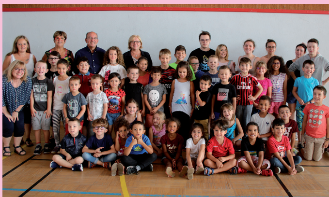
Visite de M. le Maire au centre aéré

Le CLTEP a organisé, comme tous les ans, durant la période estivale un centre aéré. Le programme d'animation ambitieux, riche et varié prévoyait des ateliers créatifs, des activités sportives, des jeux, des sorties et chaque semaine, un thème différent a été abordé pour créer un centre dynamique.