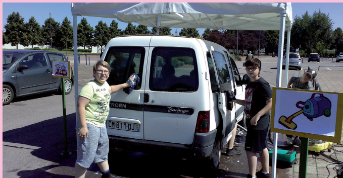
Action d'autofinancement «Lavage de voiture»

L'objectif pour l'équipe d'animation était de développer l'autonomie des jeunes (mettre la table, faire le repas, débarrasser la table, monter une tente) et l'esprit de groupe où chaque jeune avait une tâche à effectuer qui servait au groupe.