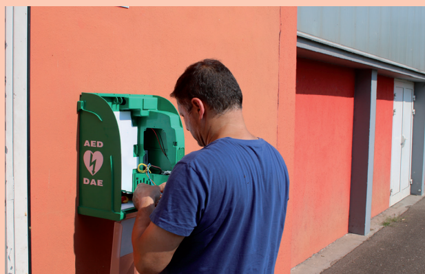
Installation d'un défibrillateur à l'extérieur de la salle M. Baquet