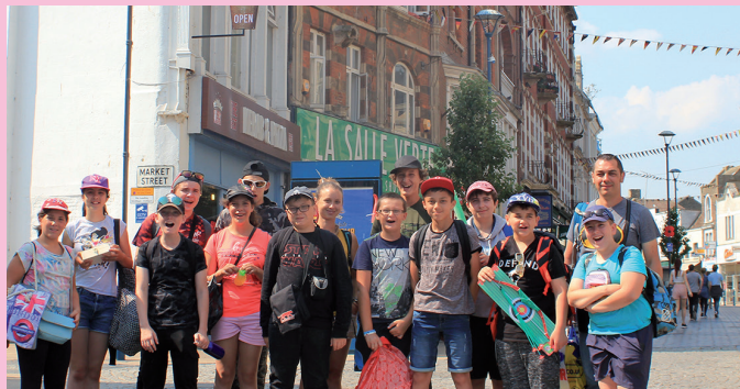
Voyage à Londres pour les Ados du CLTEP