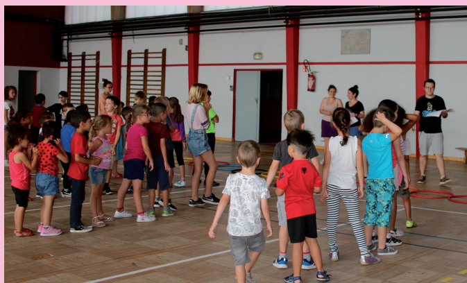
Activités ludiques au centre aéré