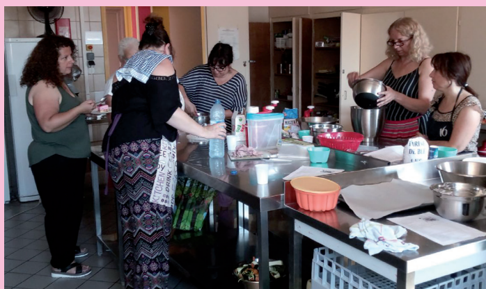
Atelier «échanges et pratiques culinaires» Les recettes proposées : «Charlotte pour un bel été à Talange» et une tarte spirale aux légumes.