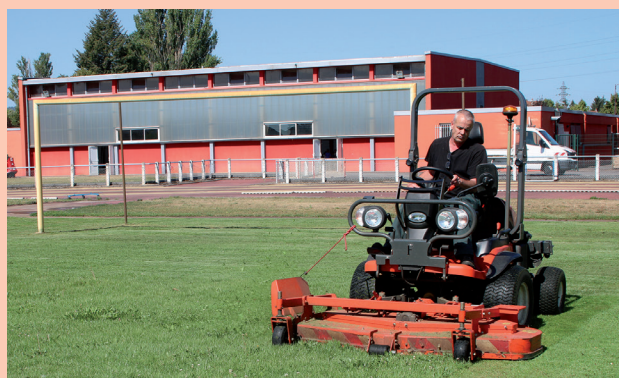
Tonte du terrain d'honneur du stade M. Baquet