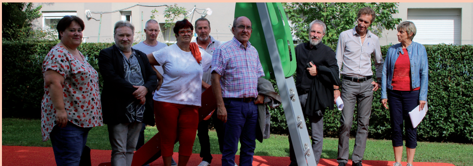
Visite des travaux réalisés dans les écoles par M. le Maire, des Elu(e)s et les services municipaux