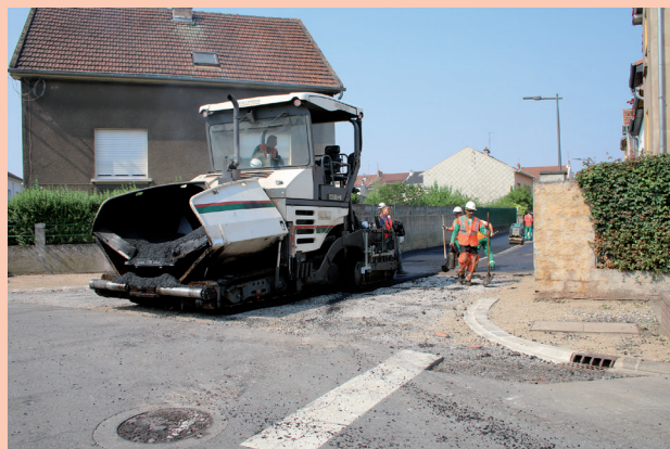
Réfection de la voirie de la rue Privée