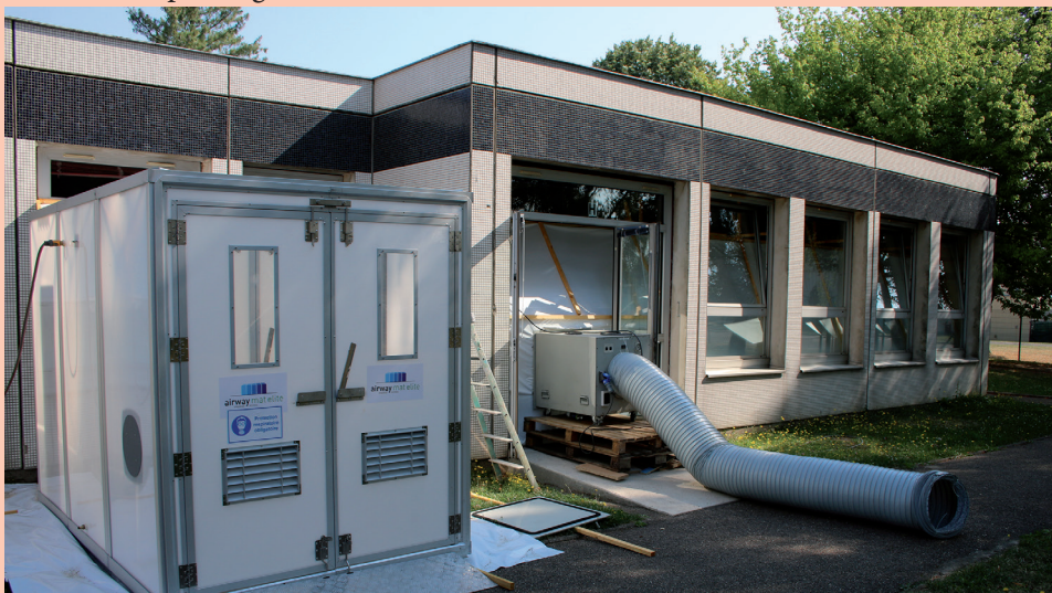
Désamiantage du sol et mise en place d'un nouveau sol à l'école Elsa Triolet

Pour finir, à noter, une nouveauté au Lycée Eiffel, le BIM ( Building Information Modeling ) qui devient incontournable dans les projets de construction ou de réhabilitation. C'est un logiciel de modélisation numérique, qui permet une création optimisée des bâtiments et des ouvrages. Cette formation complémentaire d'initiative locale et post-BTS est proposée dès cette rentrée et représente une véritable plus-value dans un cursus scolaire.